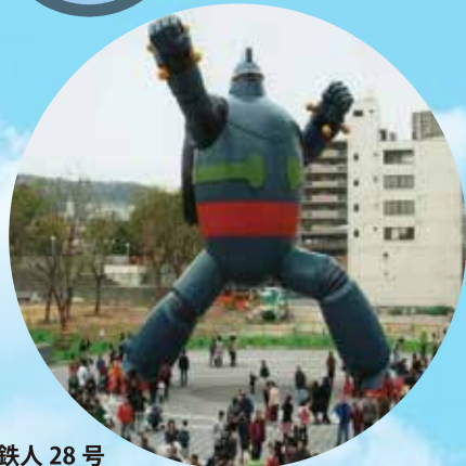
鉄人 28 号